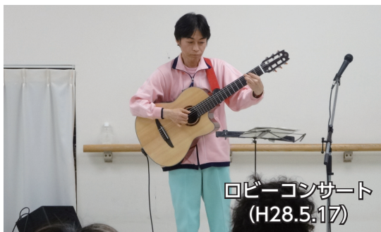
ロビーコンサート (H28.5.17)